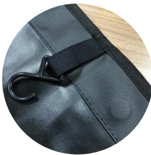
Detalle de imán y enganche.

*Con logotipo personalizado, mínimo 6 unidades.