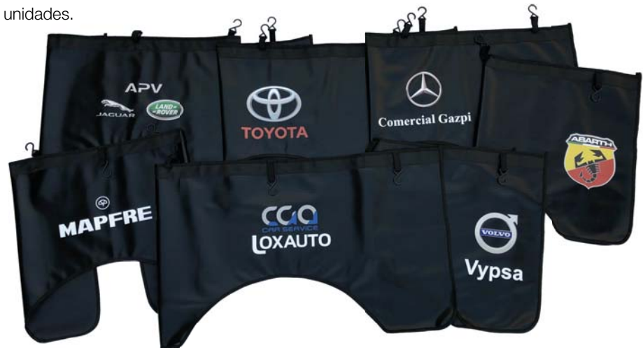
Ref.: PF. Protector frontal