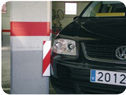
PROTECTOR PARA COLUMNA Ref: SCC