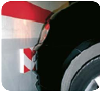
PROTECTOR PARA FONDO DE PARED Ref: SCF