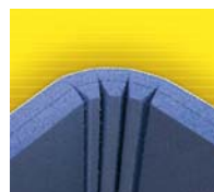
Fresado especial para columnas en esquina, chafán y columnas redondas.